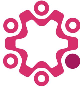
Työlainsäädäntö ja työsopimus