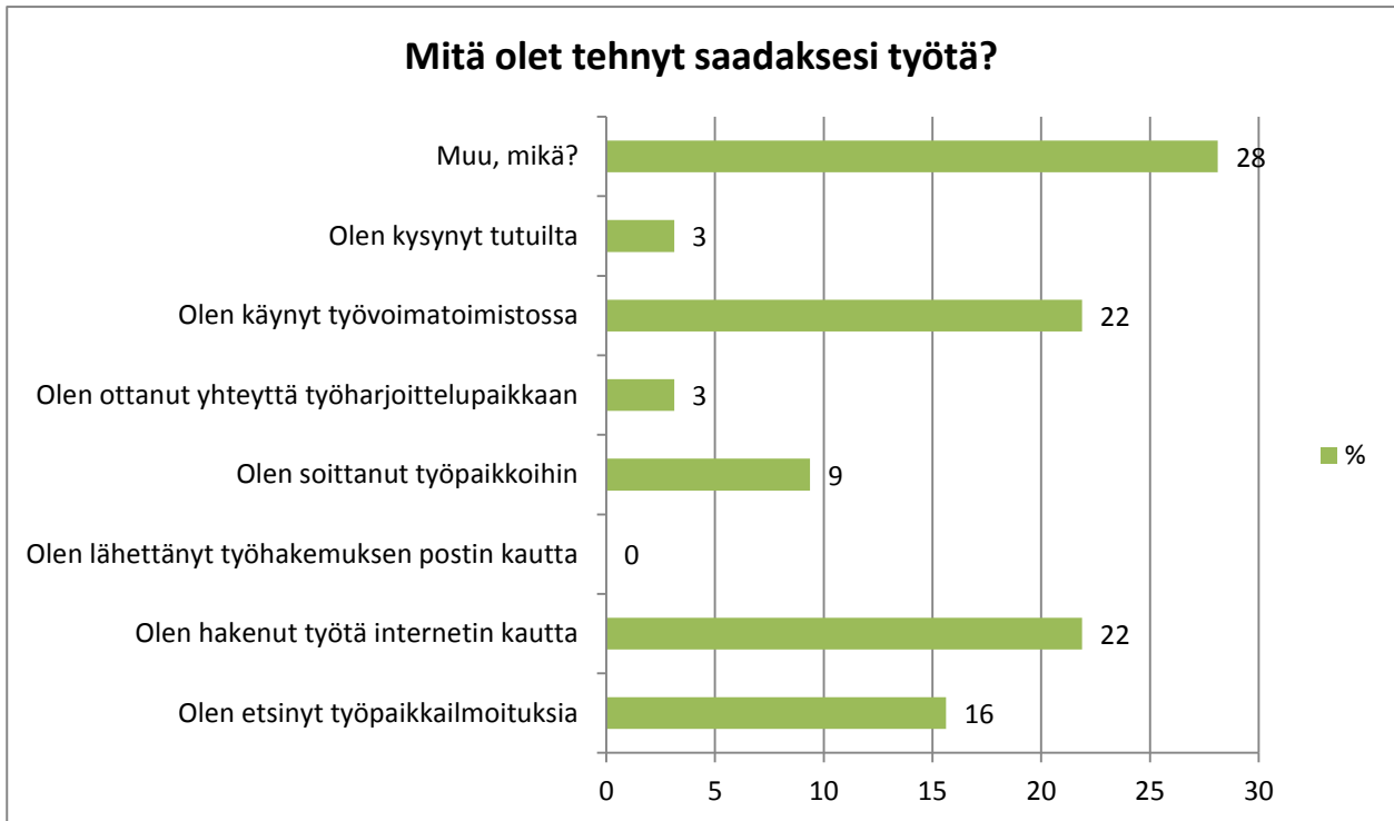
Taulukko 2. Vastaukset kysymykseen 'Mitä olet tehnyt saadaksesi töitä?'

Työttömäksi työnhakijaksi on ilmoittautunut 90 % työttömistä. 87 % työttömistä ei koe, että olisi tarvinnut tukea työnhakuun. 62 % on kuitenkin vastannut, että heitä on tuettu työnhaussa. Tukea on saatu muun muassa Työvoimatoimistosta, perheenjäseniltä ja läheisiltä, tukihenkilöltä, ammatinvalintapsykologilta sekä etsivän nuorisotyön kautta. Työttömänä olevista vastaajista 61 % on ollut työhaastattelussa.